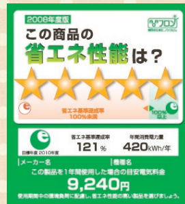
統一省エネラベル