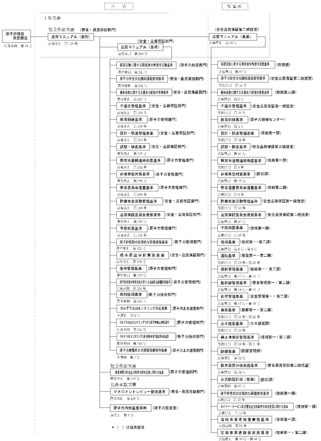
第1.17-1図 品質保証計画に係る規定文書体系図