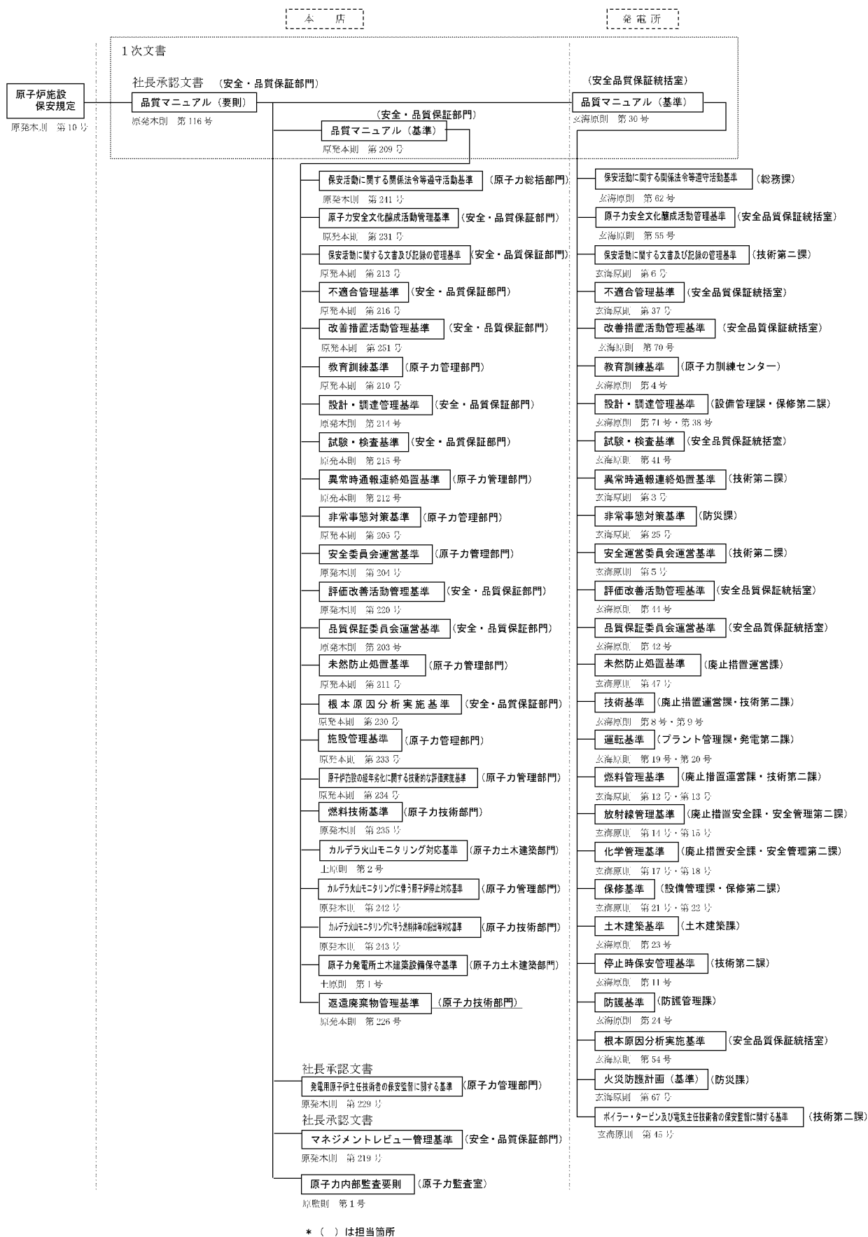
第1.17-1図 品質マネジメントシステム計画に係る規定文書体系図