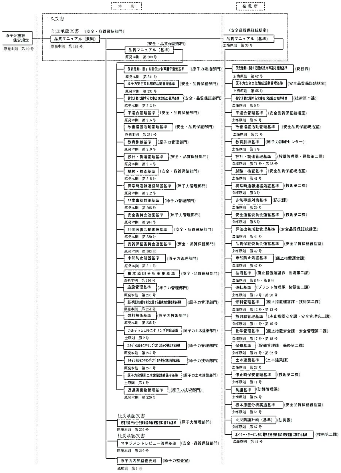
第1.17-1図 品質マネジメントシステム計画に係る規定文書体系図