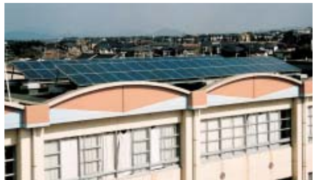
福岡市 三苫小学校 (2002年度 太陽光発電助成先)