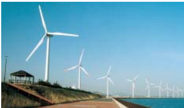
北九州市 緑エヌエスウインドパワーひびき (2001年度 風力発電助成先)

※1 設備利用率20%での試算額。なお、実際の助成は、発電実績に応じ実施。 ※2 2003年度から、従来の供給電力量に応じた助成 (kWh助成) を設備出力助成 (kW助成) に変更。