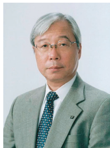
九州電力株式会社 代表取締役社長