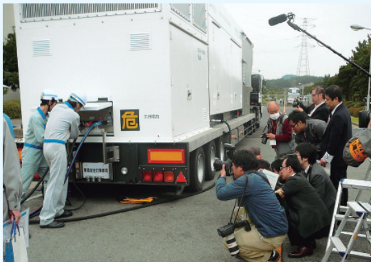
移動式大容量発電機による電源供給訓練公開の様子