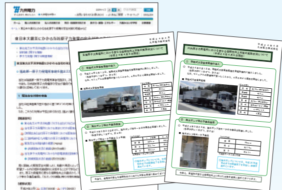
ホームページ掲載による公開