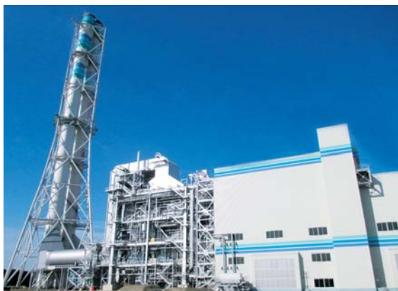
新大分発電所3号系列第4軸