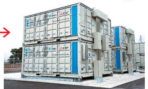
豊前蓄電池変電所(福岡県豊前市) NAS電池®(ナトリウム・硫黄電池)コンテナ252台