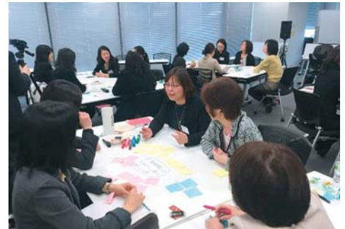
女性管理職懇談会

2018年度までの 女性管理職の新規登用数を 過去5年間の2倍 にすることを目指します。