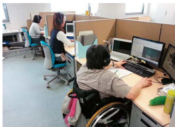
障がい者の方々の働く職場 (株)九州字幕放送共同制作センター

障がいのある方も地域・社会の中で活躍できる環境づくりに貢献するため、グループ一体となって、障がい者の雇用促進に努めています。特例子会社の(株)九州字幕放送共同制作センターでは、障がい者の方々を採用し、字幕制作を行っています。今後も、定期採用における「障がい者特別選考」の実施など、計画的な採用を進めていきます。