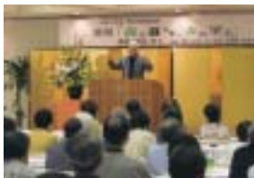
柳生博氏による講演会