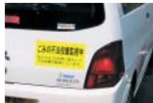
社用車にもステッカーをはり、不法投棄抑止をPR