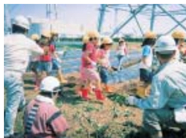
ふれあい農園(新大分発電所)