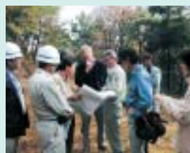
審査員に説明を行う九州林産*社員 *九電グループ会社、社有林の管理を担当

外部審査の継続受審は、森林管理の信頼性向上並びに社有林が持つ多様な機能や効果の継続的な維持・向上に繋がり、地域社会との共生にも寄与するものと考えています。