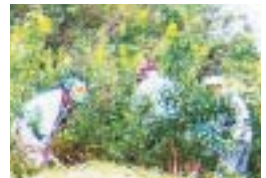
古賀グリーンパーク(福岡県古賀市)での下草刈り(年2回実施)