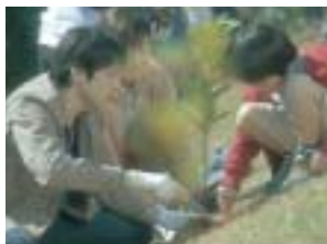
コマーシャルの一場面

2005年3月より「環境活動への取り組み」をテーマとした企業イメージCMを放映しています。九州各地で地域の皆さまと一緒に植樹する「九州ふるさとの森づくり」にスポットを当て制作しました。このCMは、身の回りにある自然を将来にわたって残していきたいという皆さまの思いを、九州電力も一緒になって叶えていきたいとの意味を込めています。