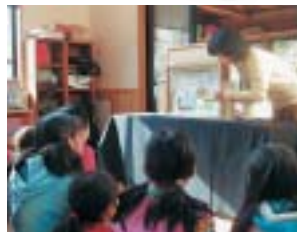
環境紙芝居の読み聞かせ