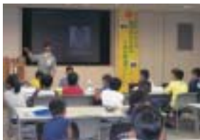
エネルギー講座(大分支店)