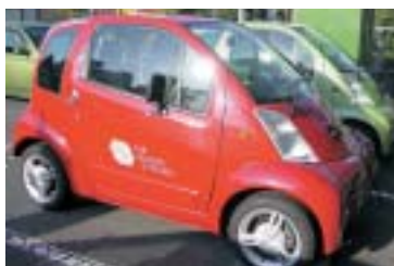
箱崎九大前ステーション(福岡市)の電気自動車