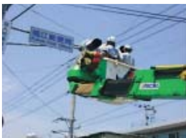
信号機の清掃(五島営業所)