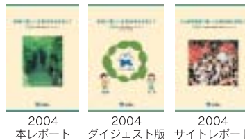
2004 本レポート 2004 ダイジェスト版 2004 サイトレポート