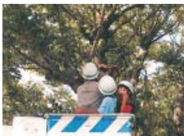
鳥の巣箱設置(飯塚営業所)