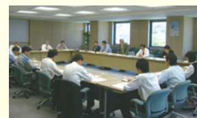
環境管理責任者会議(長崎地区)

環境への取り組み方針や目標、具体的な計画を社員一人ひとりに確実に伝えるとともに、社員の意見を幅広く聴取することができる「環境意識等調査」、「意見交換」等を今後とも継続して実施することにより、更なる環境活動の改善・充実に役立てていきます。