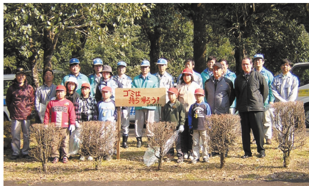
看板の設置と清掃活動に参加された皆さま

題への関心を高めることに貢献できました。その後、この小学校では児童自らが製作した不法投棄防止の看板が設置されるとともに、年2回当電力所と協力してプランタの設置、清掃活動を行うなど環境活動の輪が広がりを見せています。