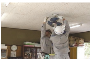
清掃ボランティア