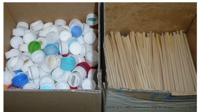
ペットボトル蓋・割り箸回収箱

また、生ごみについては、生ごみ処理機で堆肥化し構内緑化用の肥料として利用しています。