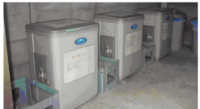
生ごみ処理機設置状況