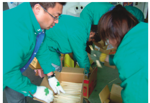
割り箸の箱詰め風景