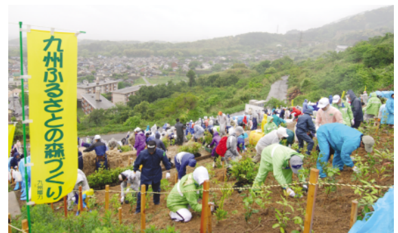
「九州ふるさとの森づくりin大町町」での植樹風景

2007年度は、佐賀支店主催により杵島郡大町町にて実施された「九州ふるさとの森づくりin大町町」へ参加し広葉樹15,000本の植樹を行いました。