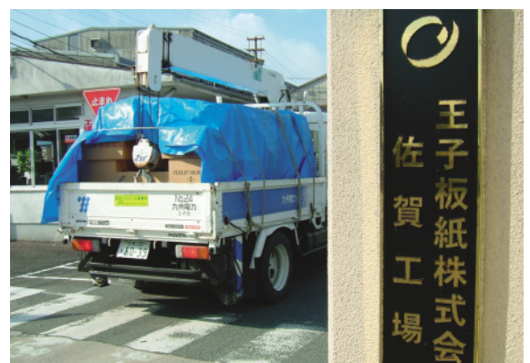
王子板紙(株)佐賀工場への運搬