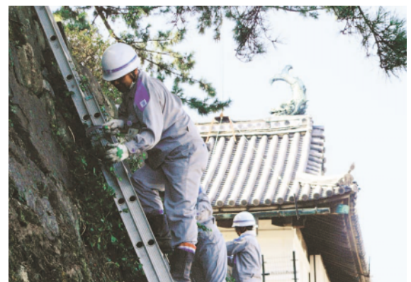
佐賀城跡「鯨の門」周辺清掃

環境美化活動の一環として、毎月15日に事業所周辺の清掃活動を実施しています。また、「お客さまありがとうございますキャンペーン」の一環として佐賀城跡「鯨の門」と石垣及び周辺清掃を実施しています。