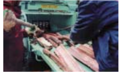
破砕機による粉砕