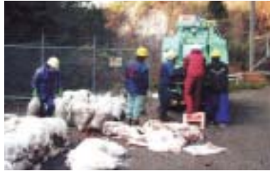
流木塵芥の袋詰め