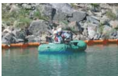
オイルフェンス設置及び油回収

水力発電所は河川に油が流出しない設備の構築を行っていますが、万一油が流出した場合に備え、迅速・的確な対応により、被害を最小限に抑えることが出来るように年1回定期的な訓練を行っています。