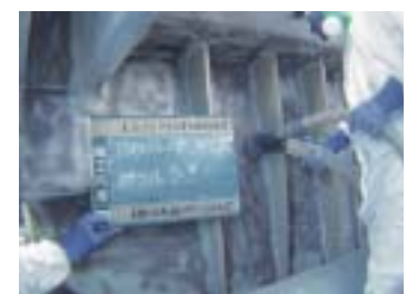
石綿除去作業状況