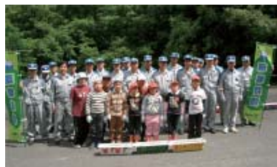
プラントの設置と清掃活動に参加された皆さま