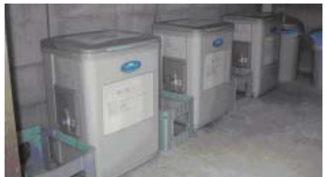
生ごみ処理機設置状況