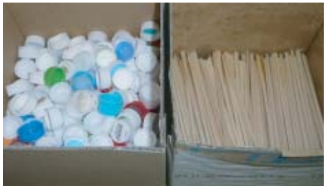
ペットボトル蓋・割り箸回収箱

また、生ごみについては、生ごみ処理機で堆肥化し構内緑化用の肥料として利用しています。