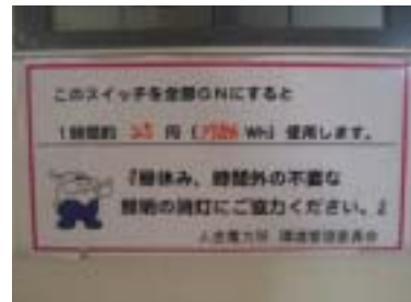
スイッチ部の標識

また、当電力所では環境にやさしい行動の一環として「樹木に優しい前向き駐車」にも取り組んでおり、お客さま用駐車場に呼びかけ看板を設置し、協力いただいています。