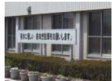
「前向き駐車」呼びかけ看板