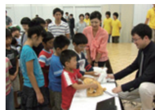
こども科学研究室(北九州支店)

また、子どもたちのエネルギー・環境問題や科学への興味を喚起する参加・体験型の実験イベント「こども科学研究室」等を実施しています。