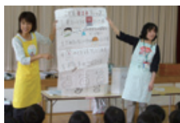
かすが 春日町幼稚園エコ・マザー活動 (大分県大分市)