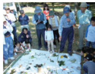
「女子畑いこいの森」での自然観察会

2009年度は、9団体452人を受け入れ、これまでの受入総数は、延べ77団体2,754人となっています。