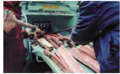
破砕機による粉砕