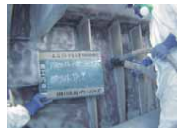
石綿除去作業状況