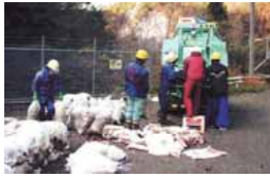
流木塵芥の袋詰め