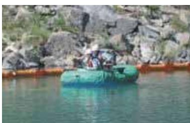
オイルフェンス設置及び油回収

水力発電所は河川に油が流出しない設備の構築を行っていますが、万一油が流出した場合に備え、迅速・的確な対応により、被害を最小限に抑えることが出来るように年1回定期的な訓練を行っています。