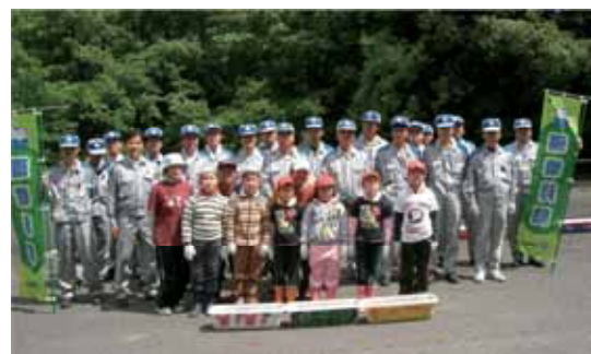
プラントの設置と清掃活動に参加された皆さま