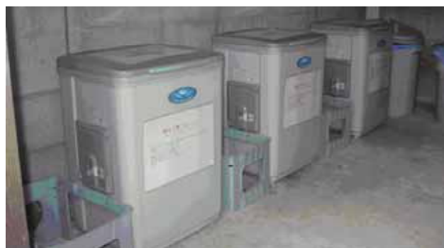
生ごみ処理機設置状況