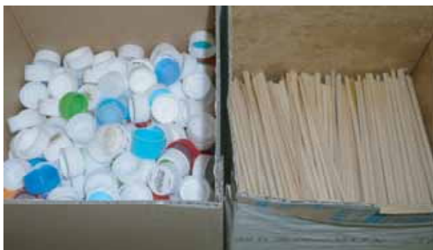
ペットボトル蓋・割り箸回収箱

また、生ごみについては、生ごみ処理機で堆肥化し構内緑化用の肥料として利用しています。