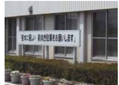
「前向き駐車」呼びかけ看板