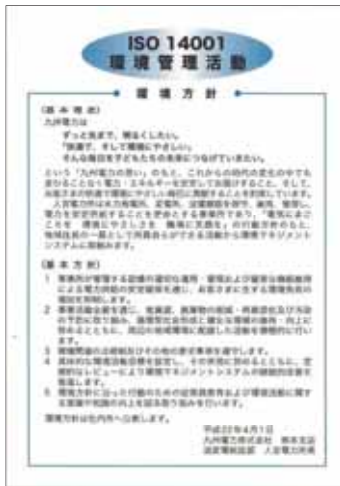
詳細はP5をご参照下さい。

環境方針は事務所に掲示するとともに、EMSに関する認識を促すため、活動内容を併記した環境活動カードを全所に配布・携帯し、常に環境保全を意識するようになっています。