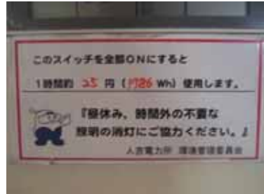
スイッチ部の標識

また、当電力所では環境にやさしい行動の一環として「樹木に優しい前向き駐車」にも取り組んでおり、お客さま用駐車場に呼びかけ看板を設置し、協力していただいています。