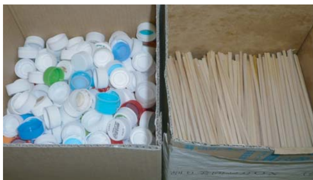
ペットボトル蓋・割り箸回収箱

また、生ごみについては、生ごみ処理機で堆肥化し構内緑化用の肥料として利用しています。