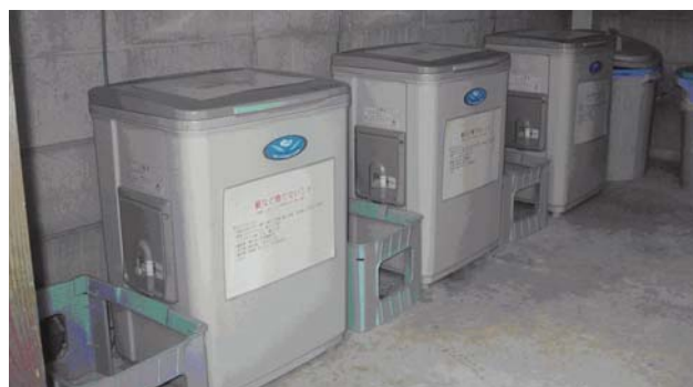
生ごみ処理機設置状況