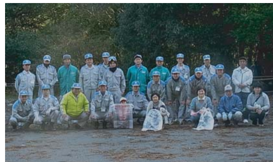
プランタの設置と清掃活動に参加された皆さま