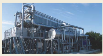
山川発電所のバイナリー発電設備