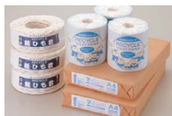
回収した古紙で作った製品

古紙のリサイクルについては、取組みを開始した2002年度以降、100%リサイクルを継続しており、回収した古紙の一部は、グループ会社の九州環境マネジメント(株)で、コピー用紙、紙ひも、トイレトペーパーに再生されています。