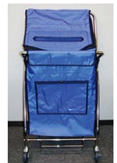
機密文書専用回収ボックス

また、お客さまから機密文書を回収するにあたっては、セキュリティに配慮した回収ボックスや文書類の盗難及び飛散防止等の機能を有した車両を使用しています。