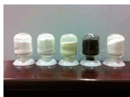
リサイクルしたレアアース