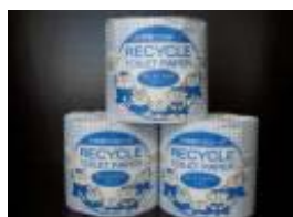
グリーン製品(左:トイレ用紙、右:コピー用紙)