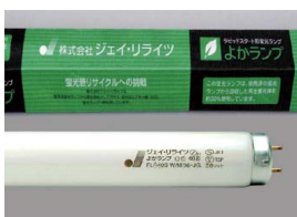
リサイクル蛍光管*よかランプ