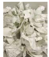
破碎処理した文書類