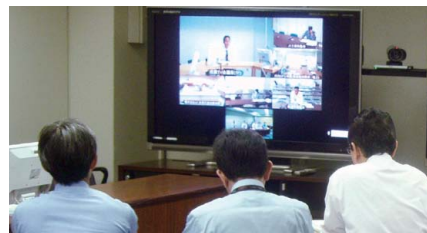
環境担当管理職研修の様子

さらに環境月間においても社内外講師による社員向け講演会を12事業所で実施し、372人の社員が聴講しました。