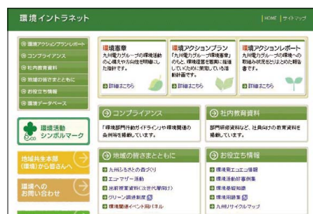
環境イントラネット

社内のパソコンネットワークを活用して、環境専門の情報データベースを構築し、社員の環境意識の高揚や環境活動の実践、管理者の支援等に役立てています。