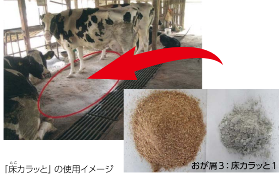
「床カラッと」の使用イメージ