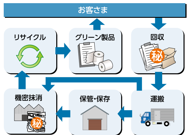
機密文書リサイクル事業のイメージ図

2013年度は、九州電力及びグループ会社の文書を1,057トンリサイクルしました。これは、紙の原料として、樹齢50年の立木(直径14cm、高さ8m)の21,140本分に相当します。