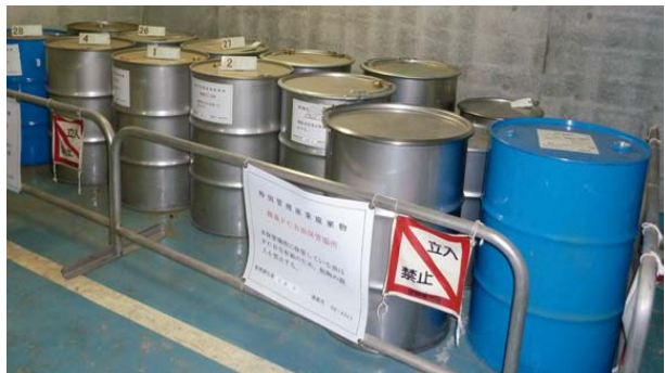
PCB廃棄物の保管・管理状況