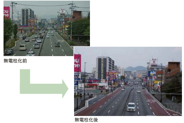
福岡県内の地中化路線(2014年度整備)

これまでの取組みにより、当社管内では、市街地の幹線道路等を中心に、約791km(2015年3月末現在)を無電柱化しました。