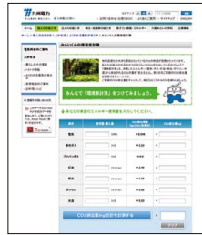
当社ホームページ「みらいくんの環境家計簿」

消費したエネルギーから排出されるCO 2 の量を「見える化」する当社の「みらいくんの環境家計簿」を活用し、電気のみならず、ガス、水道、ガソリン等についても使用量削減に努めています。