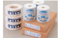
回収した古紙で作った製品

古紙のリサイクルについては、取組みを開始した2002年度以降、100%リサイクルを継続しており、回収した古紙の一部は、グループ会社の九州環境マネジメント(株)で、コピー用紙、紙ひも、トイレトーパーに再生されています。