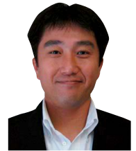
(株)キューヘン 総務部 総務グループ