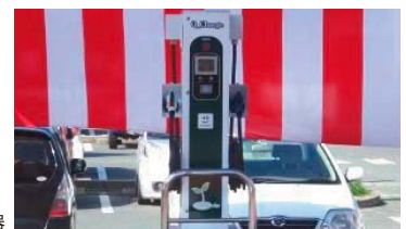
電気自動車用急速充電器