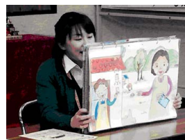
紙芝居を使った省エネお手伝いサービスのPRの様子

この仕事は、お客さまから「来てくれてよかった。ありがとう。」というお声をいただくことが多く、私自身、その言葉に元気をいただいています。これからもより多くのお客さまに省エネに取り組んでいただけるよう、向上心を忘れず、創意工夫を凝らして頑張りたいと思います。