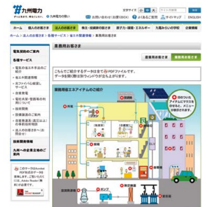
当社ホームページにおける省エネ関連情報

設備の運用改善や、ヒートポンプをはじめとする高効率機器への更新等による節電・省エネ提案など、エネルギーの効率的利用に資する活動を展開しています。