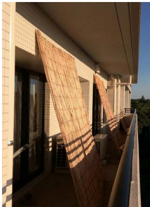
「よしず」による遮光対策(上) 自作のオーニング(日よけシート)による遮光対策(右)

2014年度は、約1,800名の社員が参加登録を行い、各家庭での節電に取り組みました。また、参加した社員から取組結果を募集し、優れた取組みや参加した感想・メッセージ等を社内のイントラネットで紹介することで、社員の意識高揚及びノウハウの共有化を図っています。