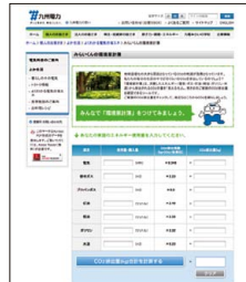
当社ホームページ 「みらいくんの環境家計簿」

消費したエネルギーから排出されるCO 2 の量を「見える化」する当社の「みらいくんの環境家計簿」を活用し、電気のみならず、ガス、水道、ガソリン等についても使用量削減に努めています。