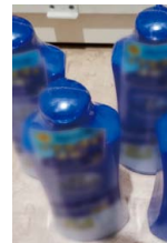
ベランダで育てた 緑のカーテン(ゴーヤ)の様子と 使用したボディローション(右)