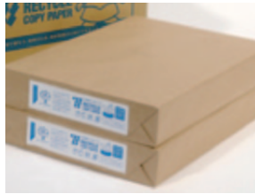
回収した古紙で作った製品

古紙のリサイクルについては、取組みを開始した2002年度以降、100%リサイクルを継続しており、回収した古紙の一部は、グループ会社でコピー用紙やトイレトーパーなどに再生されています。