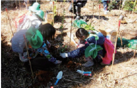
「九電の森ひとよし」での植樹活動の様子

2015年度は、約1,700名の皆さまのご協力により、3か所でボランティアによる植樹・育林活動を実施しました。これまでの15年間で、およそ117万本を植樹し、延べ約15万人の方々にご参加いただきました。