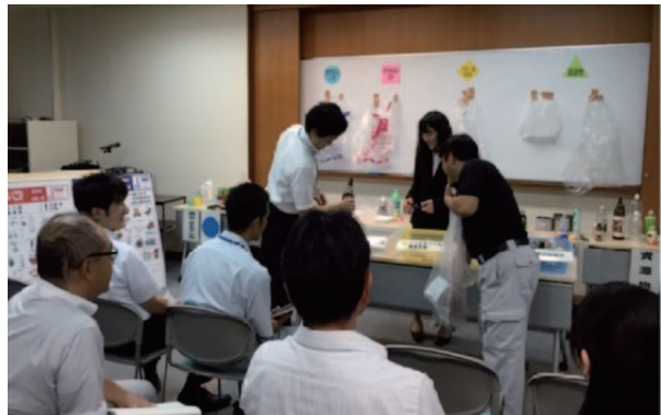
社外講師による環境講演会（鹿屋営業所）

事業所の環境業務の担当者を対象に、環境経営の推進やコンプライアンスに必要な知識の習得など、環境業務全般に係る社内研修を行っています。2015年度は環境業務を担当する初任者を対象とした研修を2回実施し、322人が受講しました。また、環境に関する社外の研修・講演会にも積極的に参加しており、2015年度は、21事業所で121人の社員が参加しました。さらに環境月間においても社内外講師による社員向け講習会を10事業所で実施し、283人の社員が聴講しました。