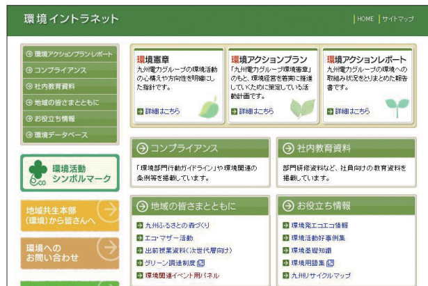
環境イントラネット

社内のパソコンネットワークを活用して、環境専門の情報データベースを構築し、社員の環境意識の高揚や環境活動の実践、管理者の支援等に役立っています。