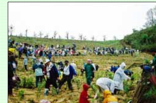
(主催：九州電力(株)大分支店、日田電力所) [2001～2003年度実施、写真は2001年度実施分]