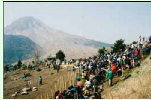
(主催：九州電力(株)長崎支店) [2001～2010年度実施、写真は2001年度実施分]