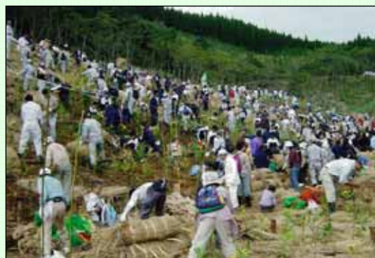
(主催：田野町水源かん養の森林づくり実行委員会) 共催：田野町、田野町教育委員会、九州電力(株) [2004～2005年度実施、写真は2004年度実施分]