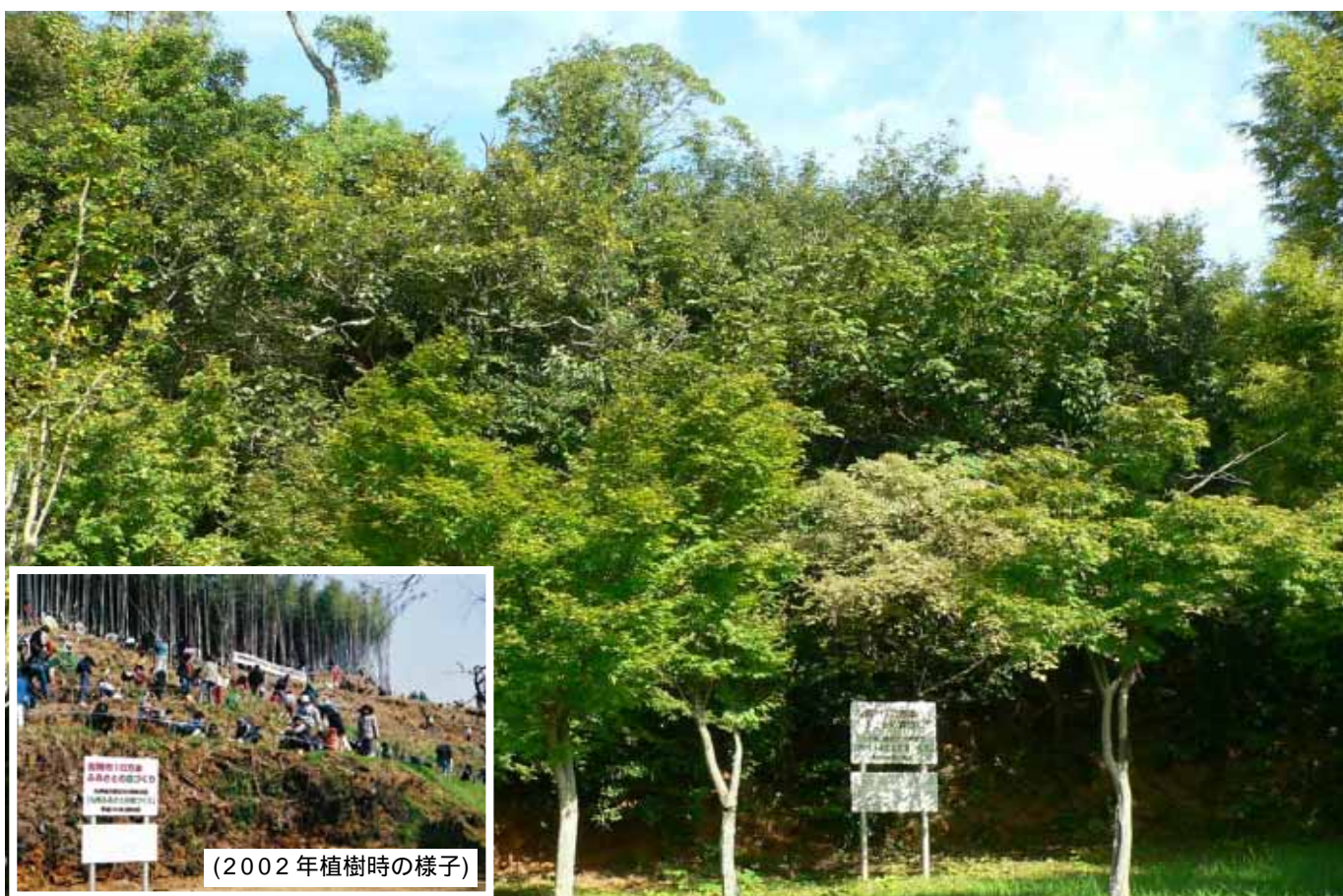
「古賀市 10 万本ふるさとの森づくり〔福岡〕」植樹地の様子(2010 年)