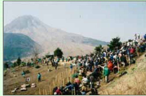
(主催：九州電力(株)長崎支店) [2001～2010年度実施、写真は2001年度実施分]