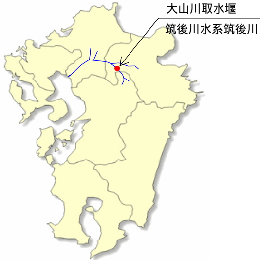
筑後川水系位置図