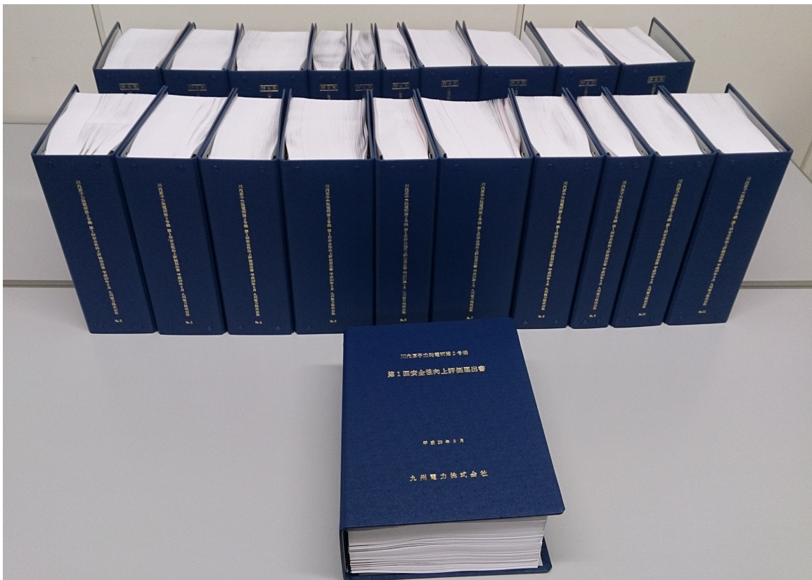
川内原子力発電所2号機安全性向上評価届出書 [約15, 600ページ(21冊)]