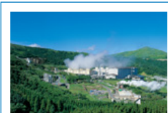
表紙写真： 国内の地熱発電としては最大規模（出力：11万kW）の八丁原発電所（大分県玖珠郡九重町）