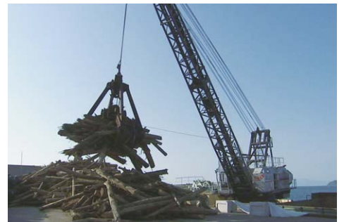
発電所への流木搬入

流木は、丸太の状態発電所に搬入し、所内でチップに加工、石炭と混ぜて発電用燃料として利用します。毎月最大2,800トン、2018年度末までに最大5万トンを受け入れる予定です。