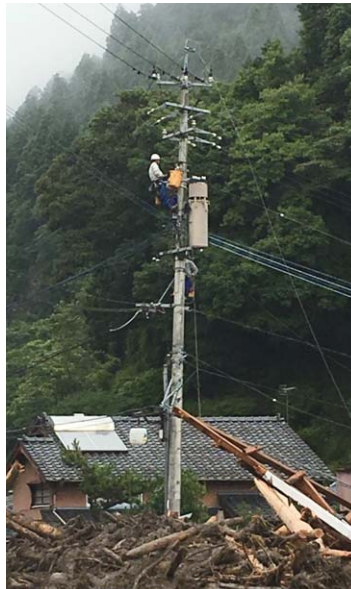
進入困難地区での配電線路復旧