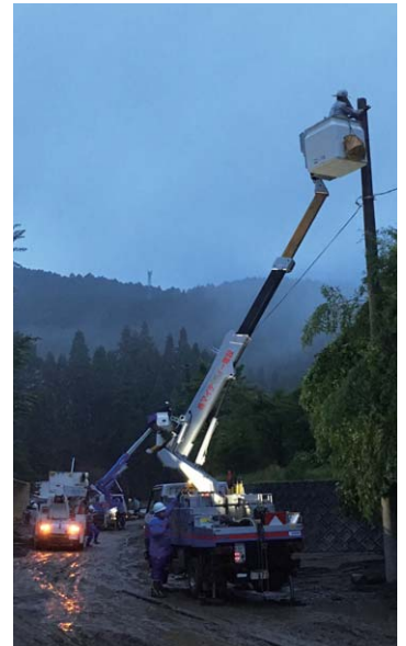
夜間における配電線路復旧