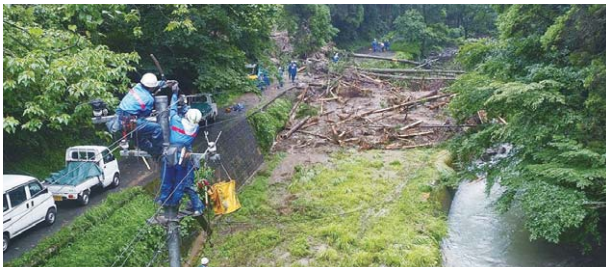
土砂崩れによる電柱流出に伴う配電線路復旧