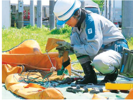
配電作業(女性社員)