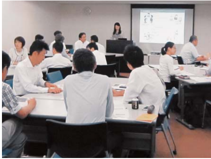
管理職が率先してダイバーシティを 推進していくためのセミナー