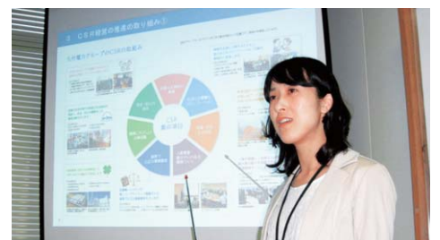
社員研修所 教育計画グループ