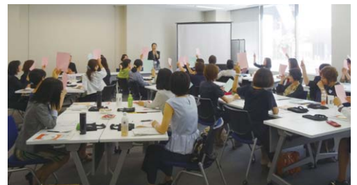
女性管理職懇談会

女性活躍推進については、2018年度までの 女性管理職の新規登用数を 過去5年間の2倍にする 目標を (2009~2013年度) 1年早く達成 しました。