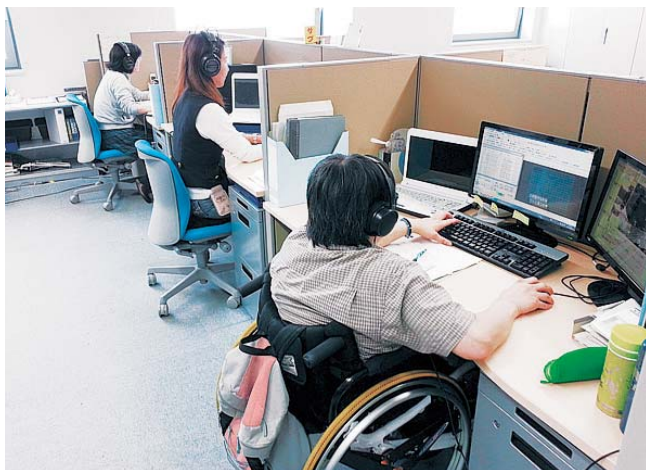
障がい者の方々の働く職場 (株)九州字幕放送共同制作センター

6名の障がい者の方々を雇用し(2017年6月現在)、音声が聴き取りにくい聴覚障がい者や高齢者の方々がテレビを楽しむための字幕を制作しています。