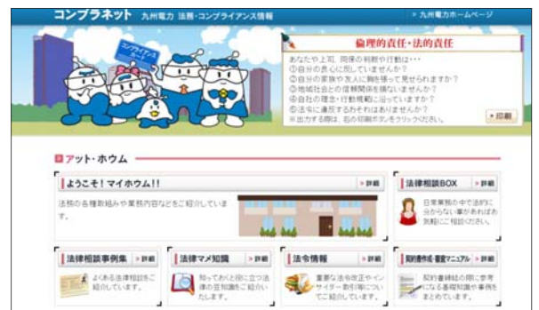
コンプライアンス情報を共有する「コンプラネット」