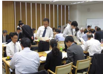
コンプライアンス研修