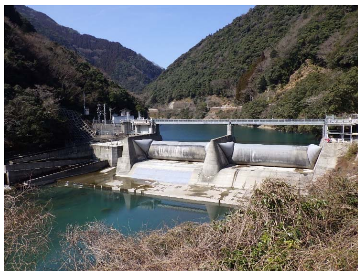
写真 - 1 ゴム堰