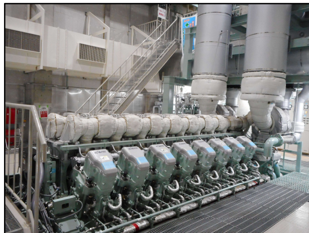
7号機発電装置外観