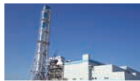
電力(国内電気事業)