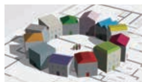
都市開発・まちづくり/ インフラサービスほか (その他の事業)