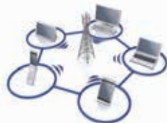
光ブロードバンド事業/ データセンター事業ほか (ICTサービス事業)