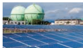
エネルギー関連事業/ 海外事業 (その他エネルギーサービス事業)