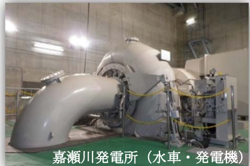
嘉瀬川発電所（水車・発電機）