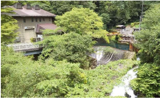
[菊池川第五発電所]