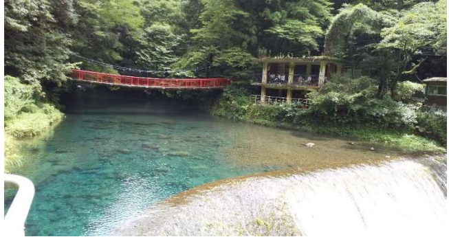
[菊池川第五発電所取水堰]