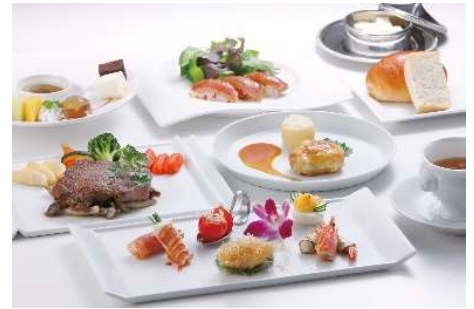
(1日目夕食 イメージ)

日本一のmeat「肉と焼酎」にmeet「会うこと」ができるミートツーリズム企画を活用し、都城産宮崎牛がメインのフランス料理をご堪能いただけます。