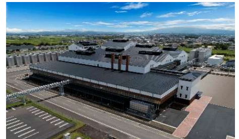
(霧島酒造工場外観)

工場見学では「見る」「聴く」「香る」「味わう」「触れる」の五感で霧島酒造の焼酎造りを楽しく学んでいただけます。(霧島酒造HPより引用)