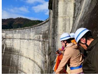
(キャットウォーク歩行体験)